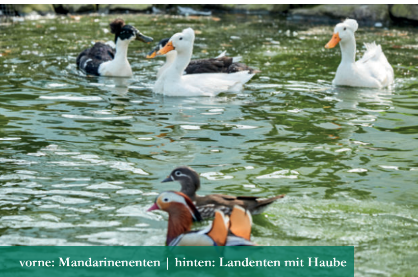
vorne: Mandarinenenten | hinten: Landenten mit Haube